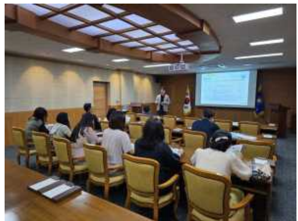
▲ 사전 간담회 진행