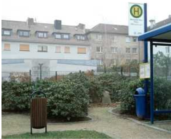
독일의 요양원 및 치매 시설 앞에 노인들을 위해 조성된 '가짜 버스정류장'은 치매 특성을 고려한 환경 조성으로 치매노인 실종 예방에 큰 효과를 보이고 있음